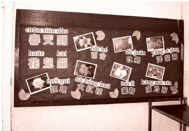
學校的告示和佈告板都加上漢語拼音

為了提升學生學習語文的效能，校方在語境教學方面下了極大功夫。甫踏入校園，你會發現學校裏大部分的佈告板、告示、標語和門牌上的文字，除了中、英對照外，還加上了漢語拼音，由此可見學校對語境教學的重視。