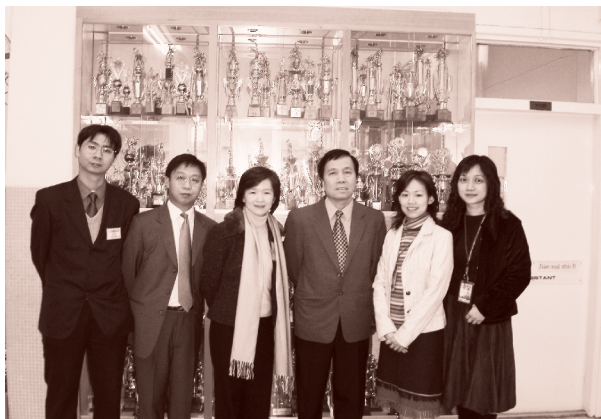
訪問結束，編輯與校長和受訪老師合照留念

生接受訓練，然後委派他們為「英語大使」或「普通話大使」，在小息、午膳時用普通話或英語跟低年級的學生交談，並在紀錄卡上簽署和記錄。低年級學生累積一定的紀錄後，同樣可以換取禮物。