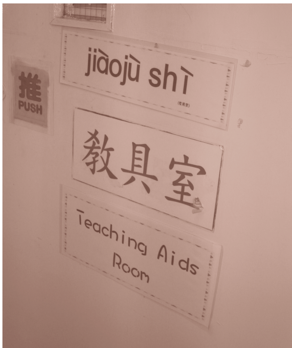
學校所有房間的門牌除標明英文、中文名稱外，還加上漢語拼音