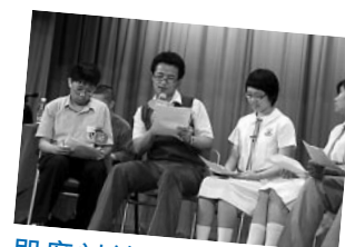
即席討論傳媒處理新聞的手法

(第3及第4場講座詳情已上載到「啟思中國語文網」 www.keyschinese.com.hk 中的「啟思愛閱讀聯盟」頁內)