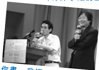
你畫、我講，好不容易啊

新學年，啟思愛閱讀聯盟繼續秉承「獨樂樂不如眾樂樂」的宗旨，積極推動閱讀風氣，各位要密切留意啟思愛閱讀聯盟的通訊啊！