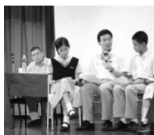
「即席小組討論」情況