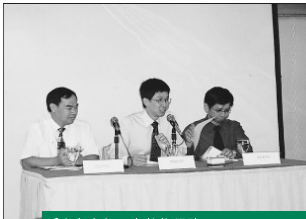
編者與老師分享教學經驗

工作坊上，兩套教材的編者與老師分享單元教學心得，又就新學年的準備工作提供了不少參考例子，現場反應熱烈。